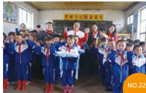
2013年5月28日 甘肃省和政县 狼土泉小学