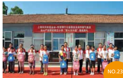
2013年6月8日 山东省潍坊市临朐县 龙山高科技产业园安家小学