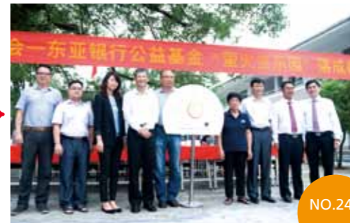
2013年9月2日 广东省清远市连山壮族瑶族自治县 永和中学