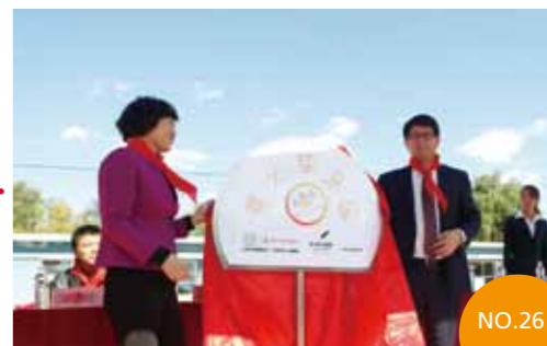
2013年10月17日 湖北省武汉市 京汉学校