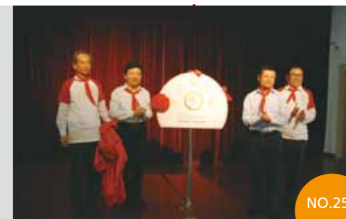
2013年10月9日 上海市崇明县 裕安中学